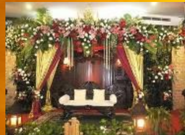
PERSEWAAN TANAMAN HIAS