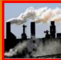
Good Manufacturing Practices