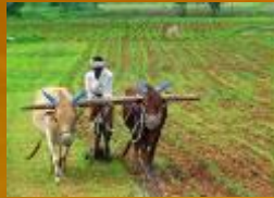
Good Farming Practices