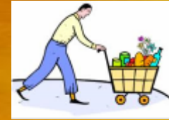
Good Retailing Practices